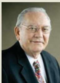
Глен Естес, председател на попечителите на ФР

Няма да е изненада за никого, че нашата първа цел през 2009-10 г. е да унищожим полиомиелита. Това е основната цел на Ротари като организация и ще остане такава, докато не бъде постигната. Пряката роля на Фондация Ротари в подкрепа на тази цел е да посрещне предизвикателството от 200 млн. щ. дол. и да се разпространи посланието, че борбата срещу полиомиелита все още не се приключила.