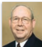
Рей Клингзинсмит Кърквил, Монтана, САЩ

Съветът на директорите на РИ има 19 членове: президент, елект президент и 17 номинирани от клубовете директори, които се избират на конгреса на РИ. Съветът ръководи делата и средствата на РИ в съответствие с Правилника и Устава на организацията. Девет нови директори и елект президентът встъпват в длъжност от 1 юли.