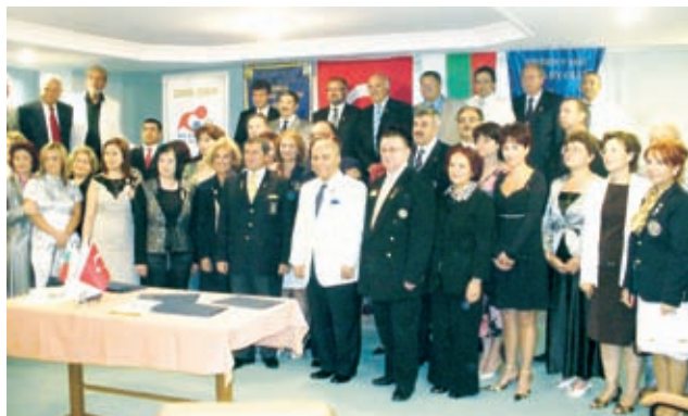
Снимка за спомен от събитието