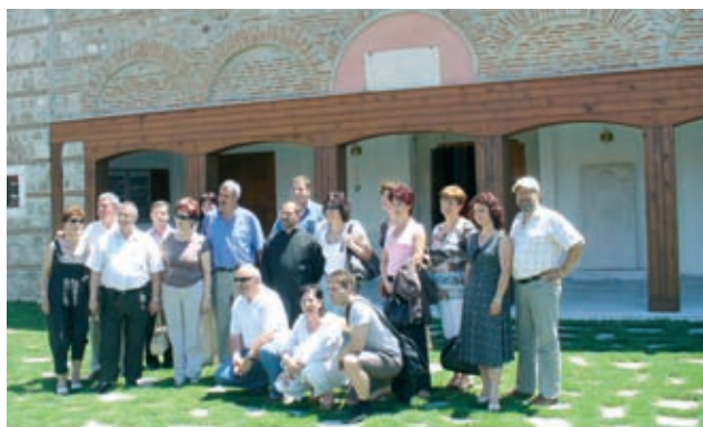
Пред българската църква „Св. Константин и Елена“ в Одрин.

побратимени клуба ползотворно взаимодействие и успешна съвместна работа по общи програми. Срещата продължи с приятелска вечеря, нови запознанства, музика и танци.