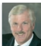
Джон Блант Себастиопол, Калифорния, САЩ

Елект президентът Рей Клингзинсмит е адвокат. Над 20 години работи в Държавния университет „Труман“ като главен консултант, професор по бизнес администрация и административен директор. Председател е на Асоциацията за хора с увреждания. „Чарлтън Вали“ от избирането му през 1982 г. През 1988 г. получава награда от Мисурския съвет по планиране за хората с вродени аномалии. Участник в програмата на Фондация Ротари „Посланически стипендии“, която през 1961 г. го отвежда в Южна Африка. Директор на РИ, председател на Изпълнителния комитет на РИ, попечител на Фондацията и вицепредседател, член на Комитета за бъдеща визия, председател на Законодателния съвет и на Организационния комитет на Конгреса на РИ през 2008 г. Крупен донор, носител на Наградата за безупречна служба на ФР. Със съпругата си Джуди живеят в Кърквил.